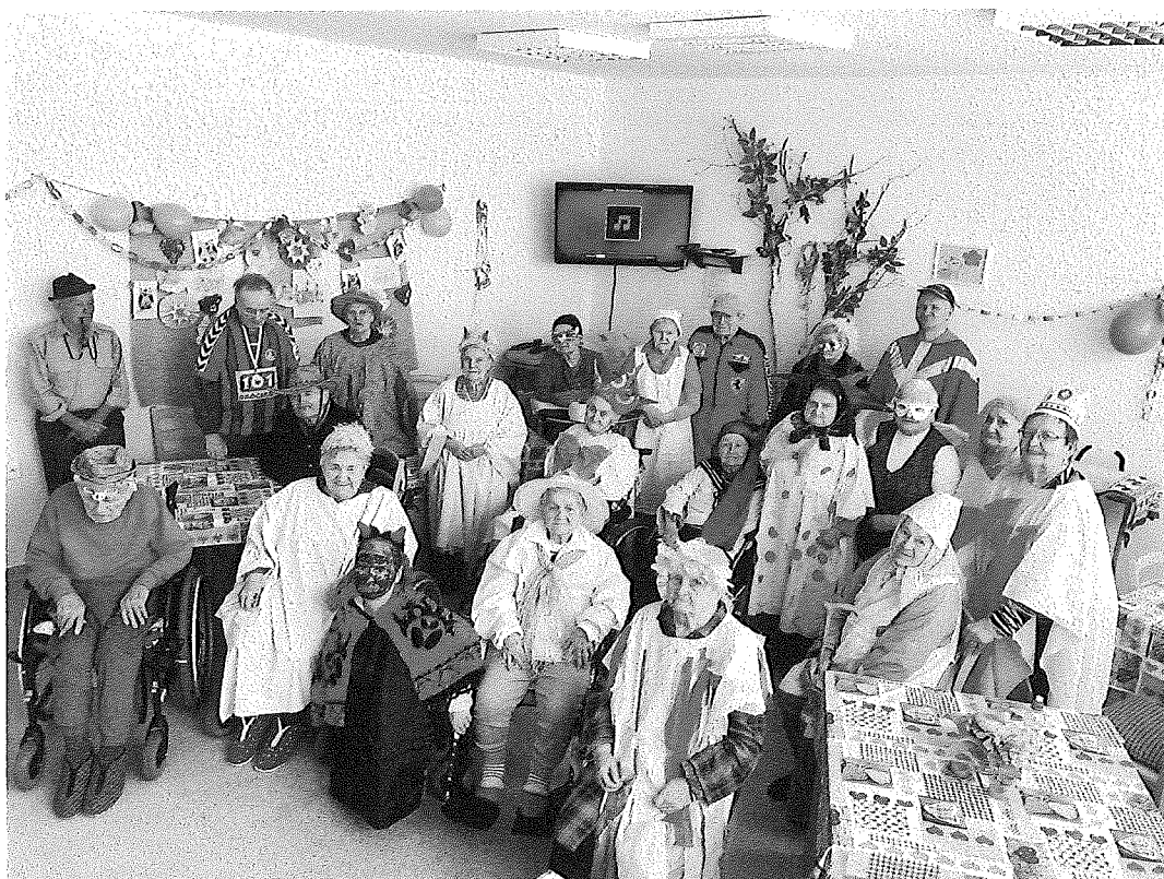
Maškarný fašiangový ples