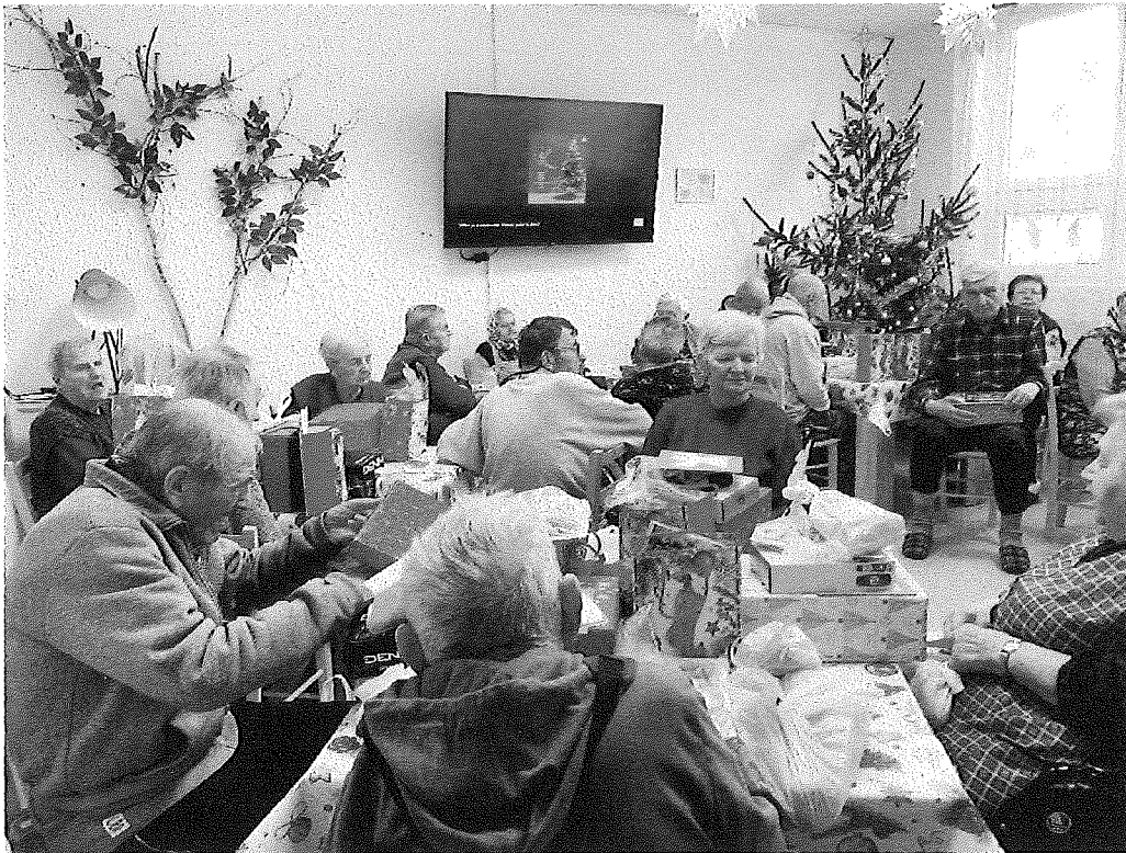
Vianočné posedenie pri jedličke a rozdávanie darčiekov