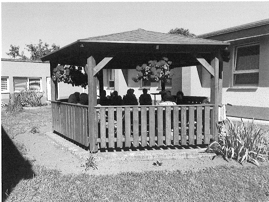
Dokončený drevený altánok v druhom átriu