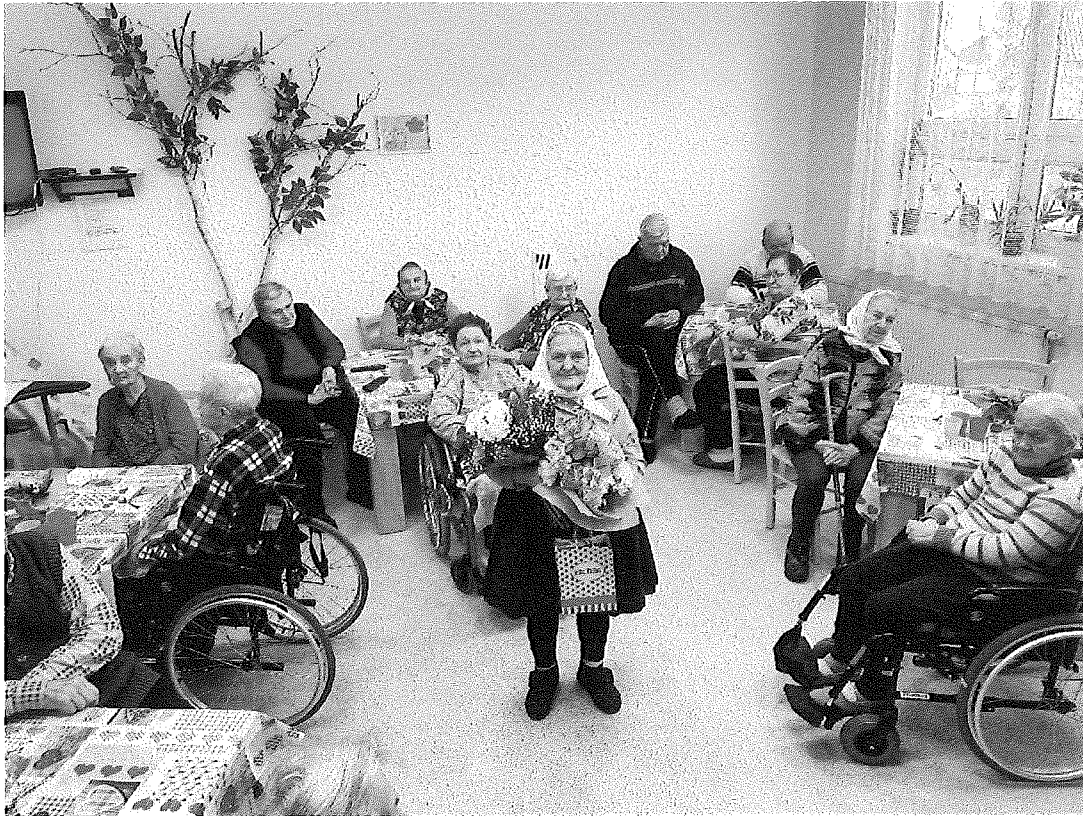
Oslava životných jubileí