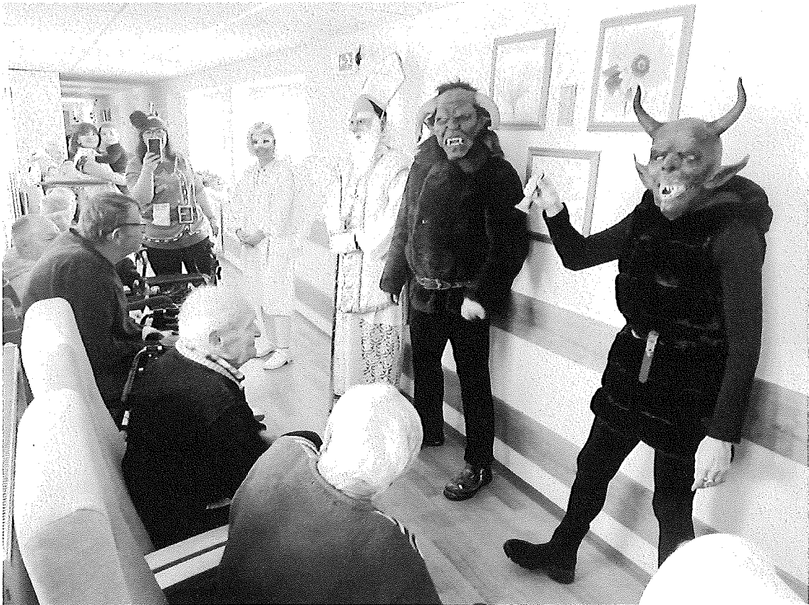
Návšteva Mikuláša v zariadení