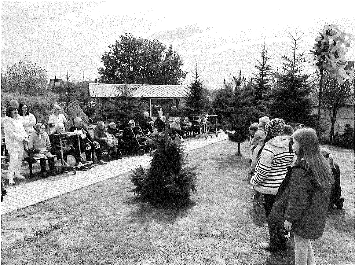
Stavanie májky s deťmi zo školského klubu