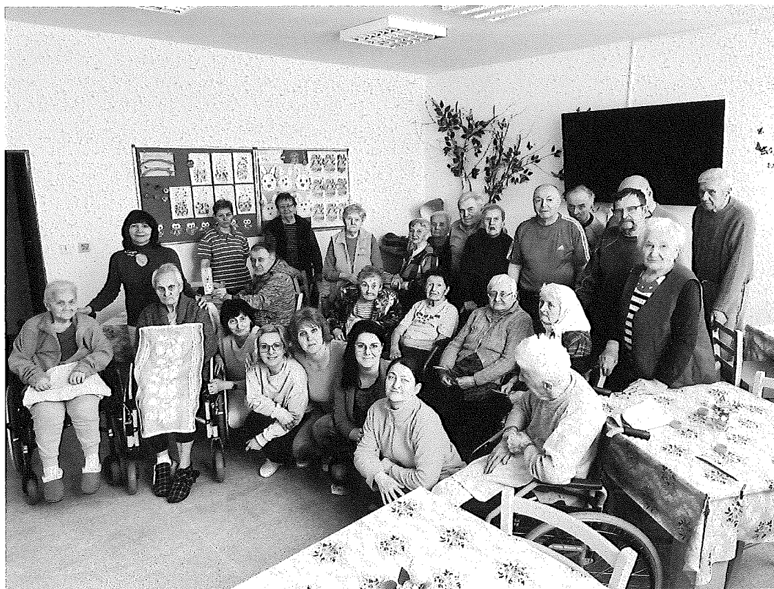
Zelený štvrtok v Barborke