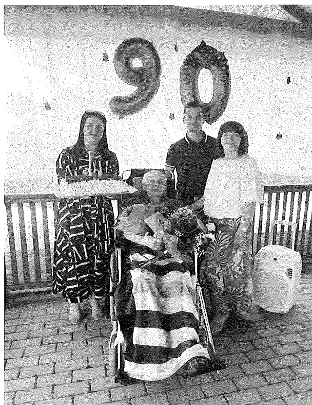
Oslava 90 rokov života