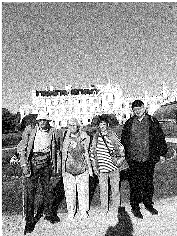
Výlet do moravskej Lednice v spolupráci s Jednotou dôchodcov Unín