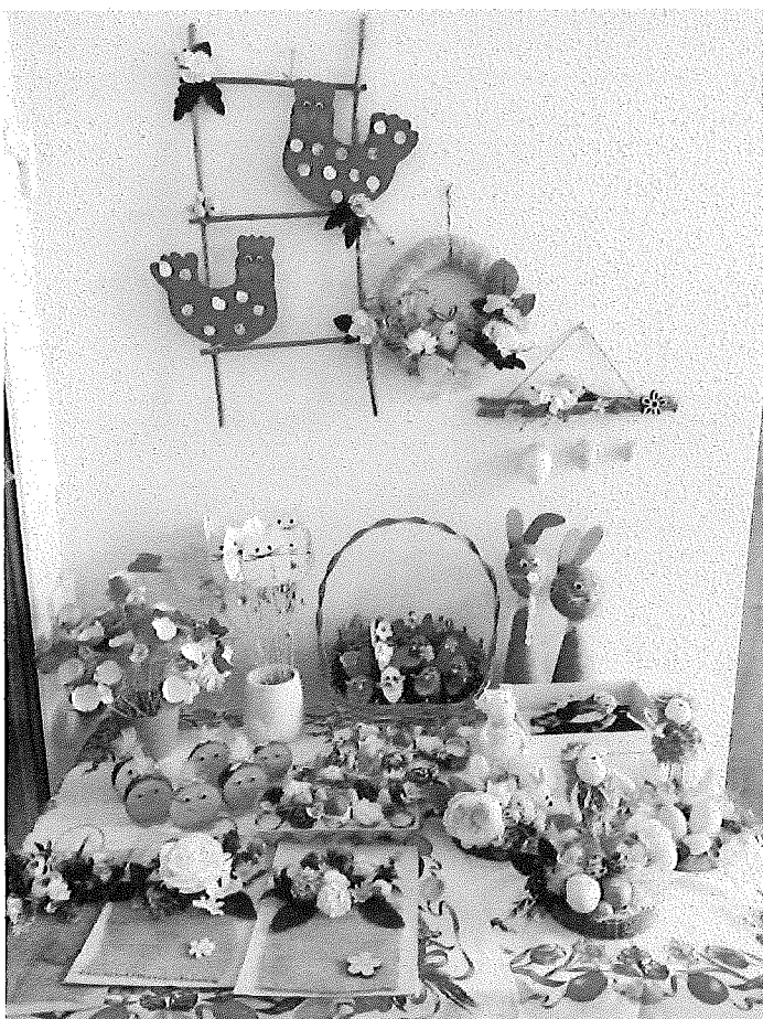
Veľkonočné výrobky- ručná práca prijímateľov sociálnej služby v našom zariadení