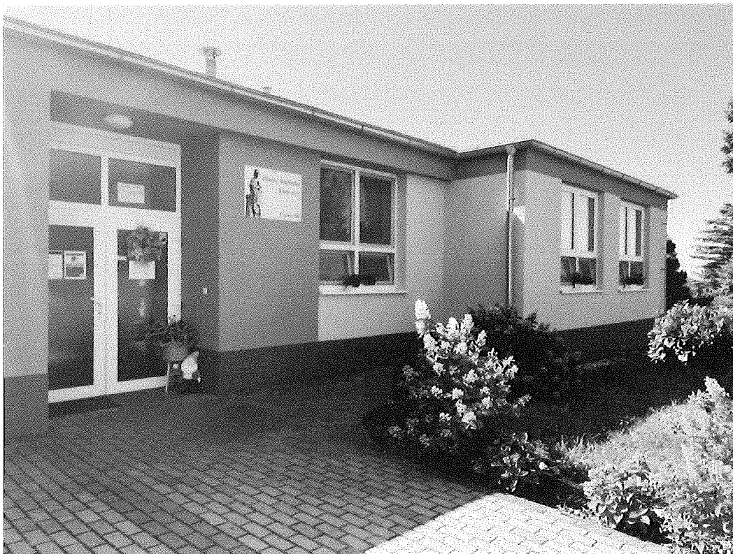
Domov Barborka Unín, n.o.