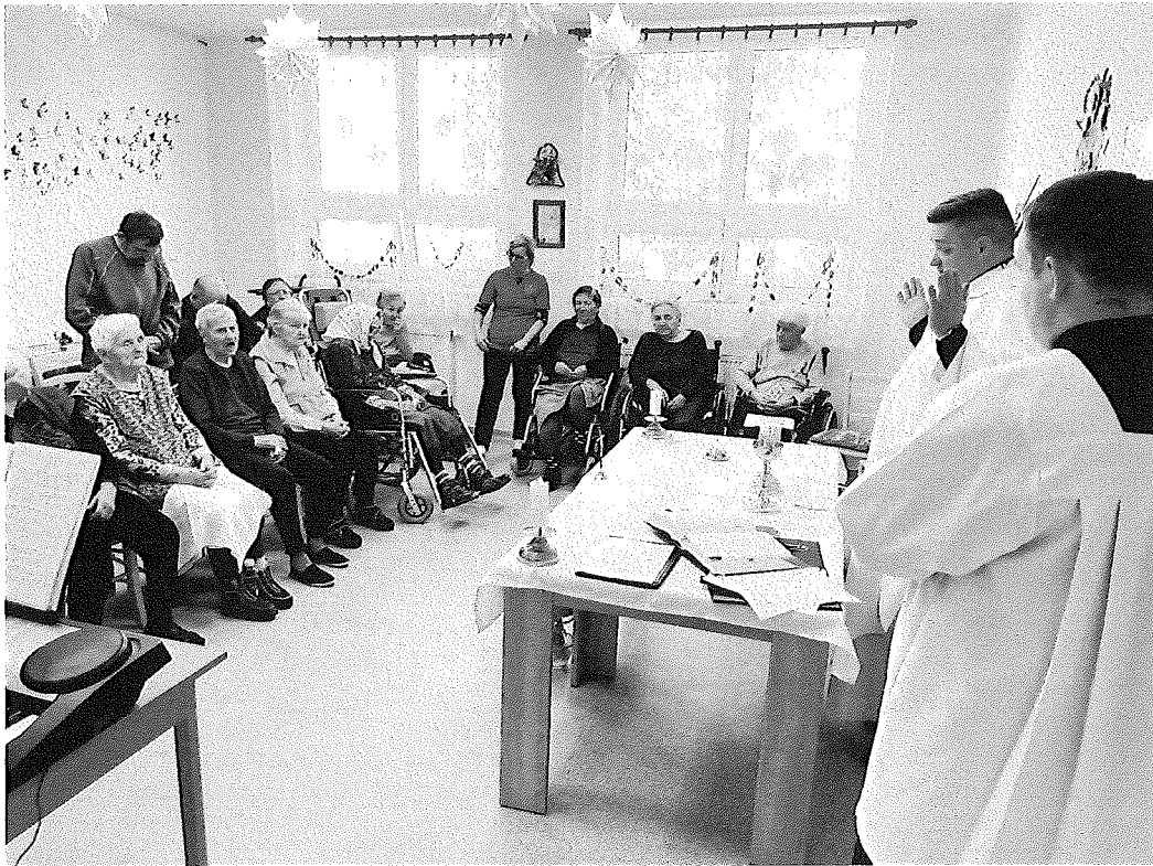
Svätá omša v zariadení, január 2023