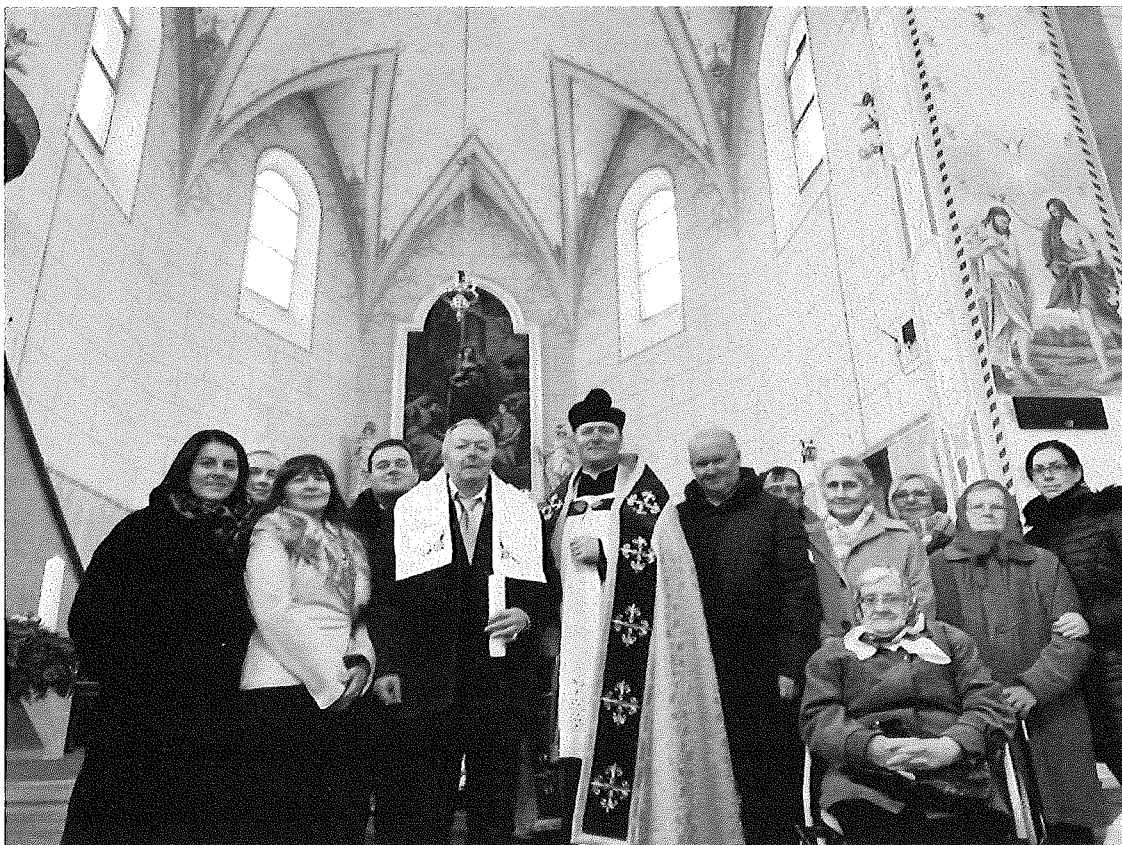
Prijatie sviatosti krstu prijímateľa sociálnej služby