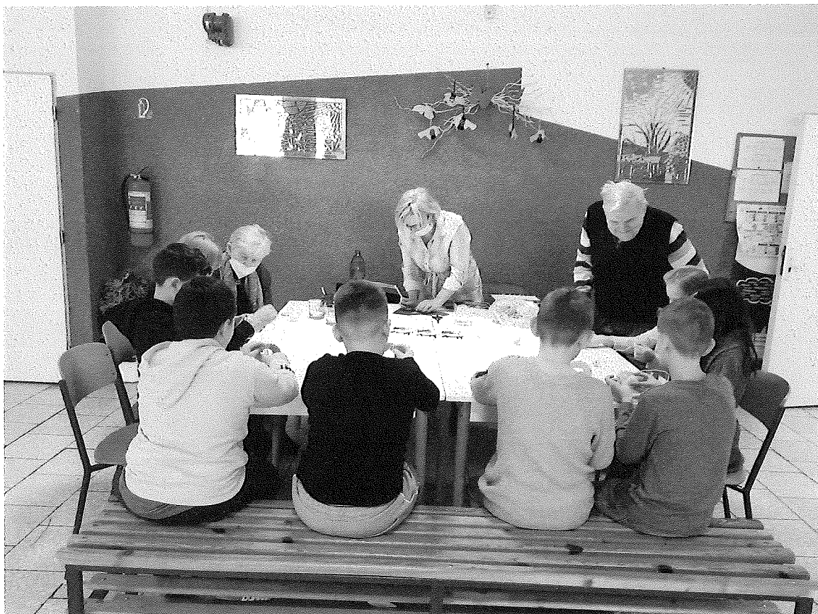
Dielničky v ZŠ Unín