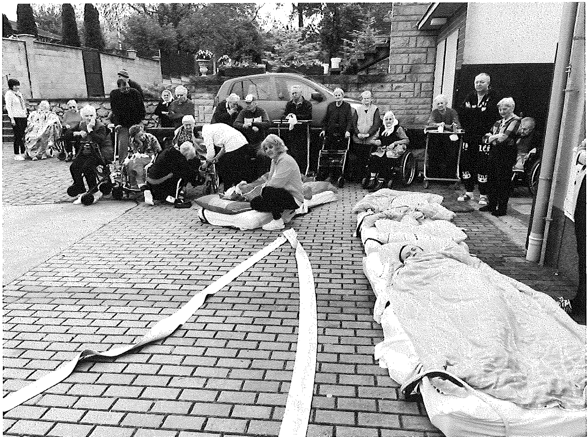
Protipožiarne a evakuačné cvičenie