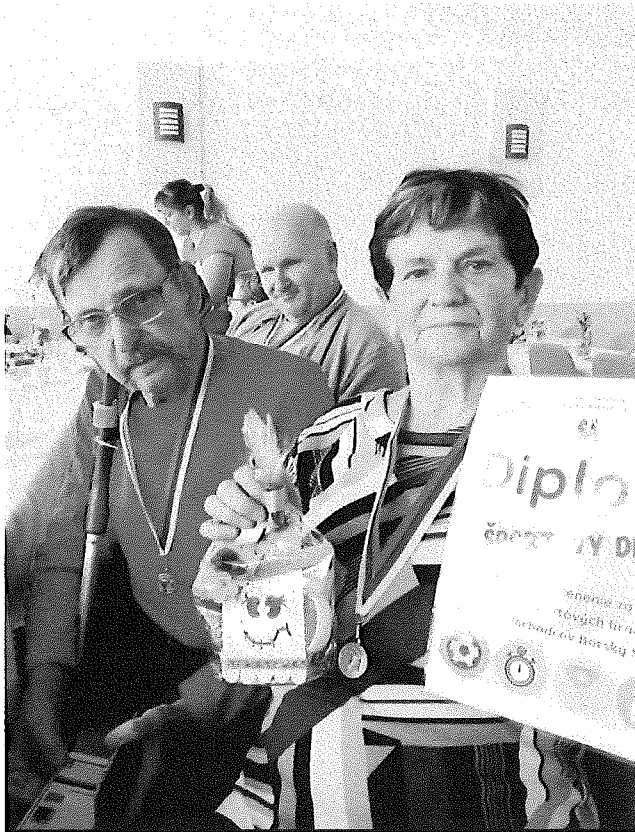
Športový deň v Borskom Mikuláši