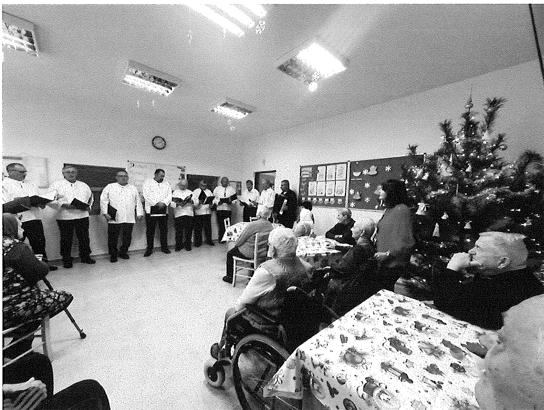
Vianočné vystúpenie „Mužákov z Unína“