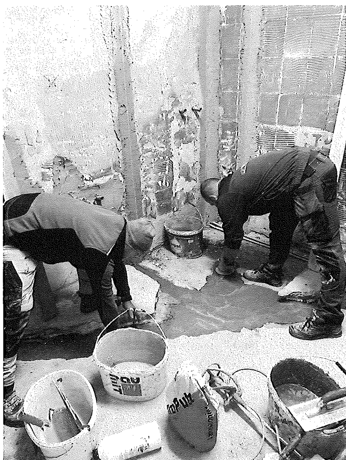
Rekonštrukcia kúpeľne v zariadení