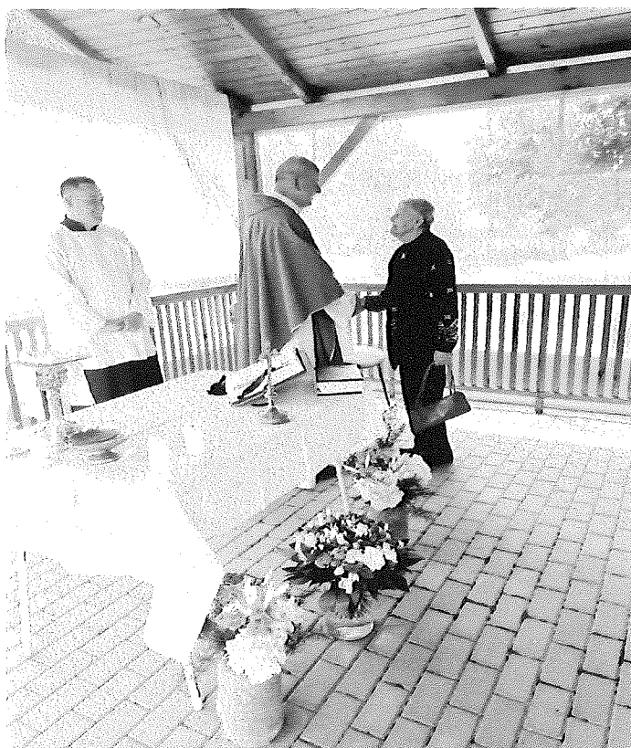
Svätá omša pod altánkom zariadenia