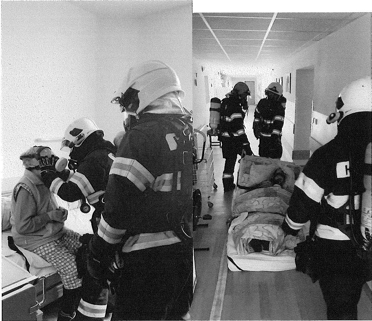
Protipožiarna a evakuačné cvičenie