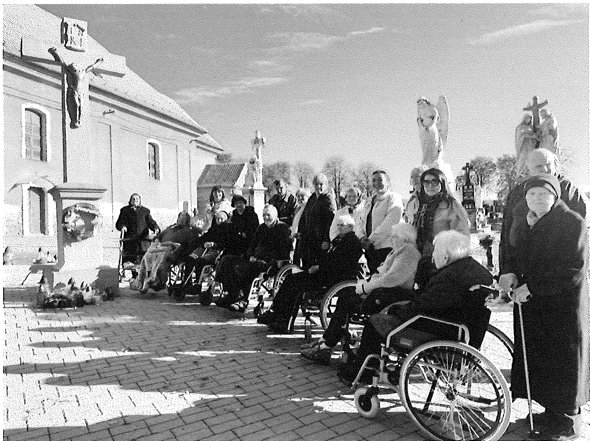
Spoločná vychádzka na miestny cintorín- 2. november, Pamiatka zosnulých