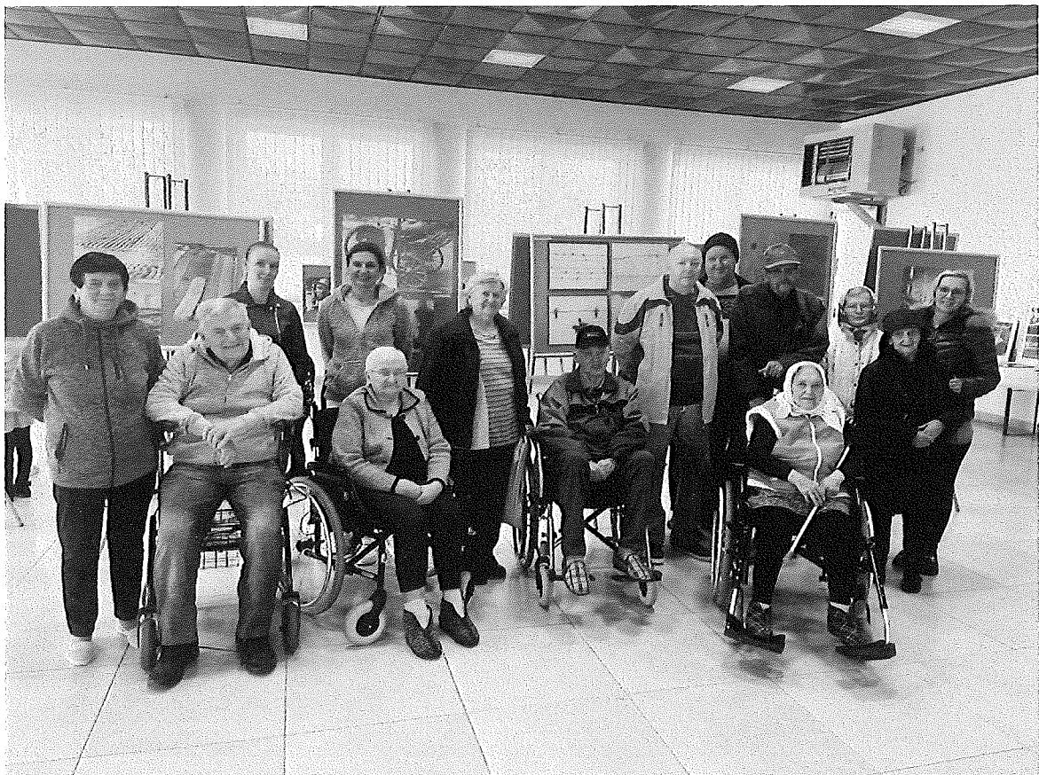
Výstava fotografií v KD Unín