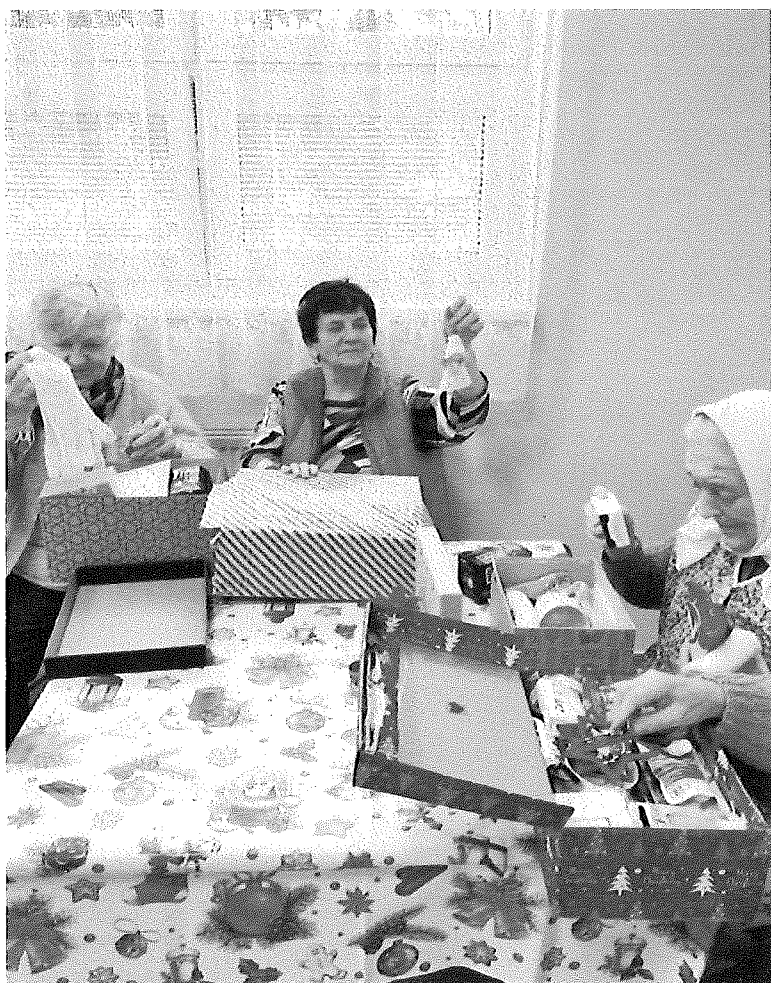
Rozbaľovanie darčiek z projektu „Koľko lásky na zmestí do krabice od topánok“