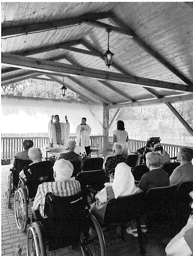
Svätá omša pod altánkom zariadenia