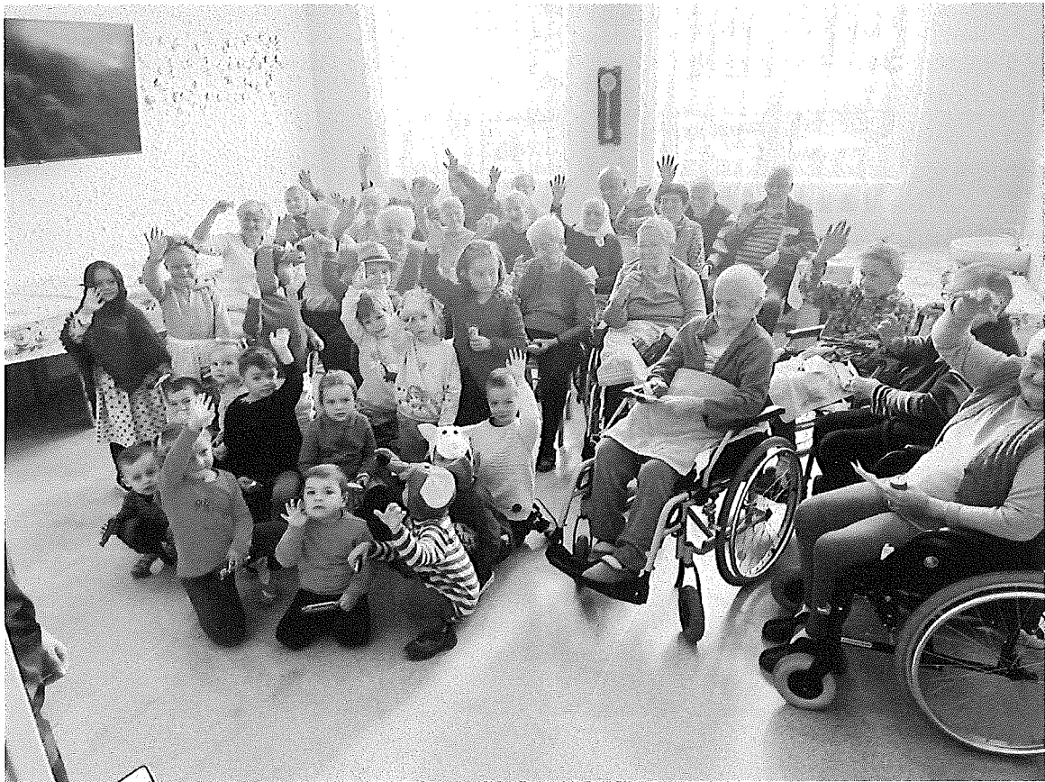
Vystúpenie detí MŠ Unín k Mesiacu úcty k starším