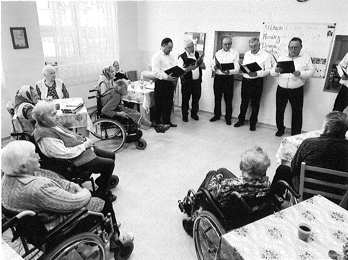
Vystúpenie „Mužákov z Unína“ k MDŽ