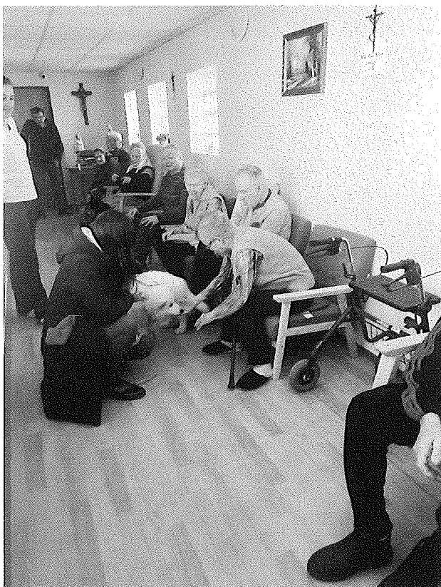
Návšteva psíka, začínajúceho cvičenie canisterapie