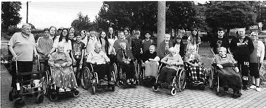
Prechádzka po dedine s deťmi ZŠ Unín