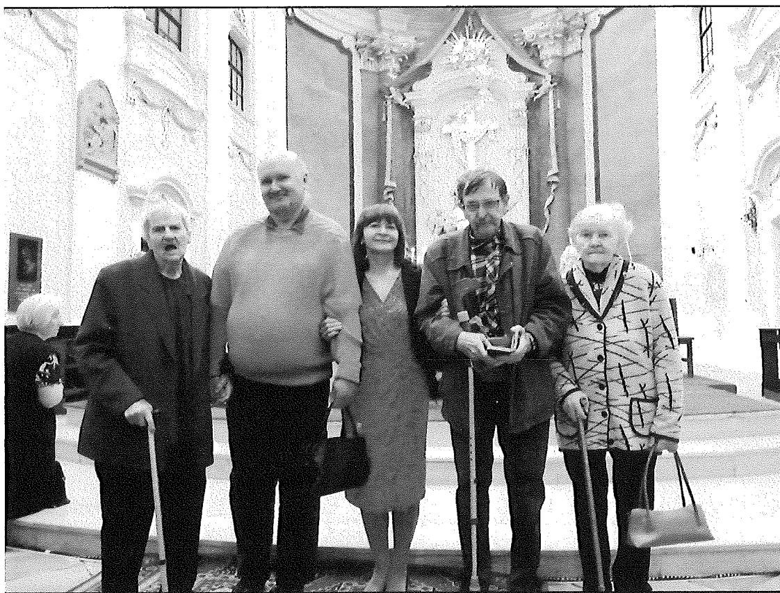
Púť v Bazilike Sedembolestnej Panny Márie v Šaštíne