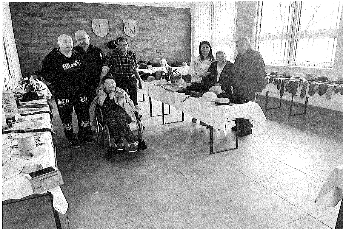
Výstava v KD Unín