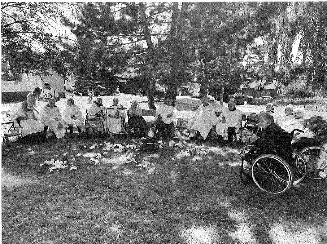
Akcia organizovaná obcou k MDD